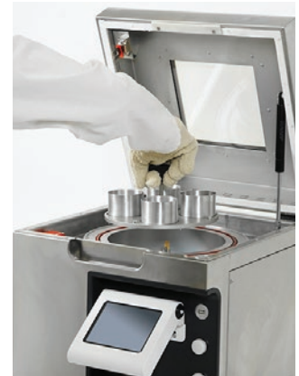
Posicionamiento del porta-muestras de doble cara

Juego de 4 recipientes de muestras de 70x45 mm para VDO