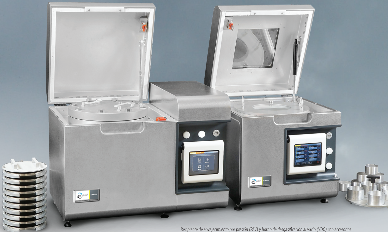
Recipiente de envejecimiento por presión (PAV) y horno de desgasificación al vacío (VDO) con accesorios