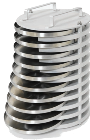
Porta muestras con diez contenedores de muestras TFOT (incluido con el equipo)