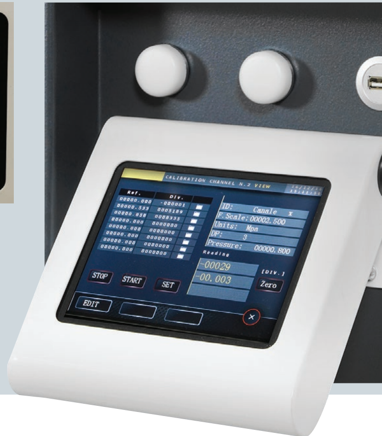
Detalle de la pantalla táctil abatible