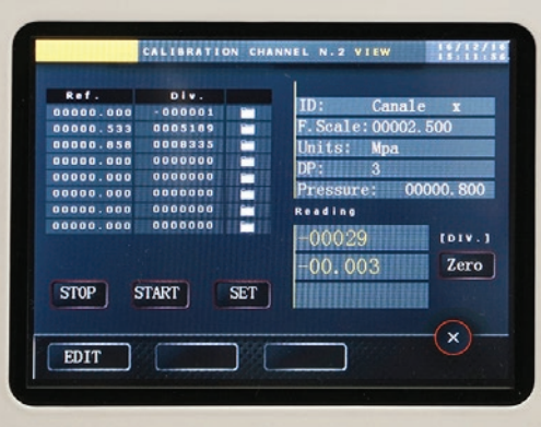
Menú de calibración del transductor de presión.