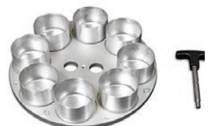
Porta-muestras de doble cara para ocho recipientes de muestras de 55x35 mm o cuatro de 70x45 mm