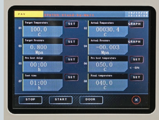
Valores objetivo de temperatura y presión frente a valores reales.